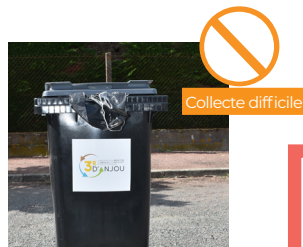
LANIÈRE OU SAC QUI DÉPASSE DU BAC