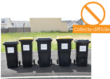
BACS JAUNES ET GRIS INTERCALÉS