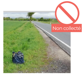
SAC POSÉ SUR LE BORD DE LA ROUTE OU À CÔTÉ DU BAC