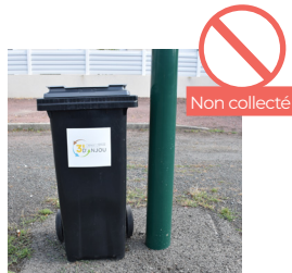
BAC TROP PROCHE D'UN OBSTACLE (POTEAU, ARBRE, VÉHICULE, ETC.)