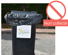
SAC PRÉSENT SUR LA COLLÈRETTE