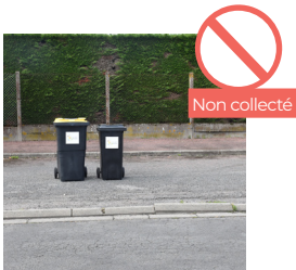
BACS TROP LOIN DE LA ROUTE