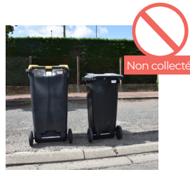
BACS POSITIONNÉS À L'ENVERS