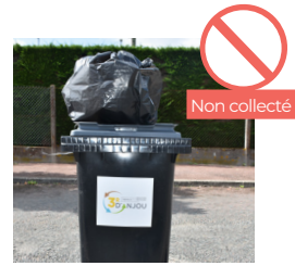
SAC OU TOUT AUTRE OBJET POSÉ SUR LE COUVERCLE DU BAC