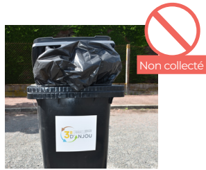
SAC DÉBORDANT (LE COUVERCLE DOIT ÊTRE FERMÉ)