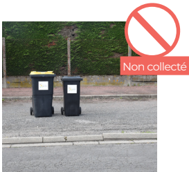
BACS TROP LOIN DE LA ROUTE