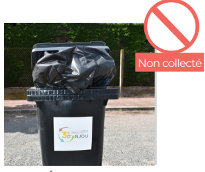
SAC DÉBORDANT (LE COUVERCLE DOIT ÊTRE FERMÉ)