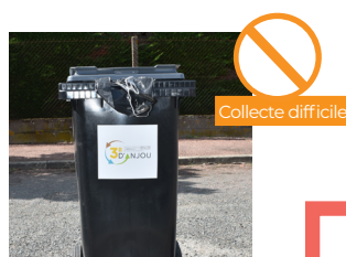
LANIÈRE OU SAC QUI DÉPASSE DU BAC