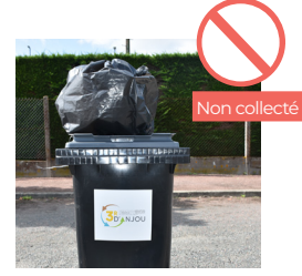
SAC OU TOUT AUTRE OBJET POSÉ SUR LE COUVERCLE DU BAC