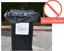
SAC PRÉSENT SUR LA COLLÈRETTE