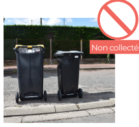
BACS POSITIONNÉS À L'ENVERS