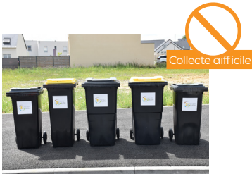
BACS JAUNES ET GRIS INTERCALÉS