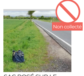
SAC POSÉ SUR LE BORD DE LA ROUTE OU À CÔTÉ DU BAC