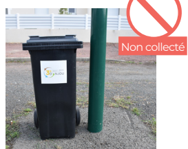
BAC TROP PROCHE D'UN OBSTACLE (POTEAU, ARBRE, VÉHICULE, ETC.)